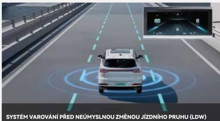
SYSTÉM VAROVÁNÍ PŘED NEÚMYSLNOU ZMĚNOU JÍZDNÍHO PRUHU (LDW)