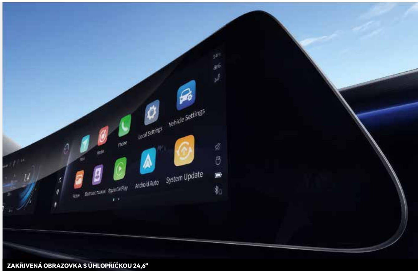
ZAKŘIVENÁ OBRAZOVKA S ÚHLOPŘÍČKOU 24,6"

Procesor Snapdragon 8155 zajišťuje výjimečný výkon a plynulost multimediálního systému. Díky němu se systém spustí za méně než 2 sekundy a je schopen zpracovat více než 20 příkazů za 30 sekund.