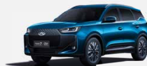
EMERALD BLUE (WE)