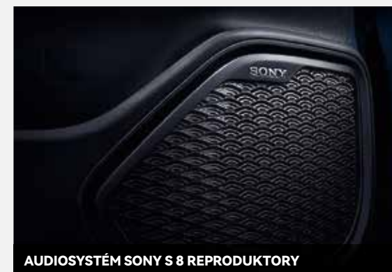
AUDIOSYSTÉM SONY S 8 REPRODUKTORY