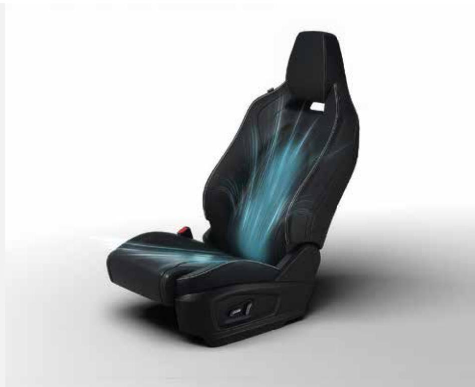
VENTILOVANÁ PŘEDNÍ SEDADLA S PAMĚTÍ POLOHY SEDADLA ŘIDIČE