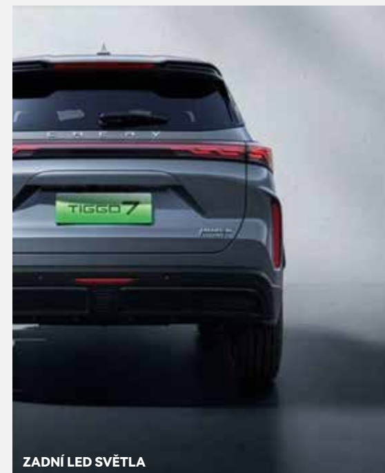
ZADNÍ LED SVĚTLA