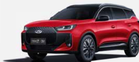
PRIME RED (ZF) – ČERNÁ STŘECHA