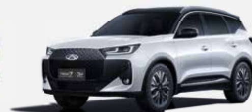
KHAKI WHITE (ZE) – ČERNÁ STŘECHA