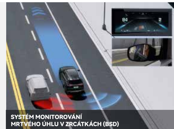
SYSTÉM MONITOROVÁNÍ MRTVÉHO ÚHLU V ZRCÁTKÁCH (BSD)