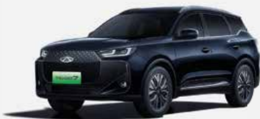
CARBON CRYSTAL BLACK (CL)