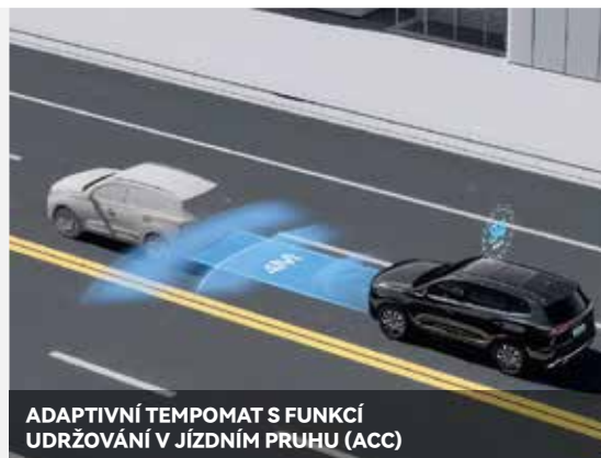
ADAPTIVNÍ TEMPOMAT S FUNKCÍ UDRŽOVÁNÍ V JÍZDNÍM PRUHU (ACC)