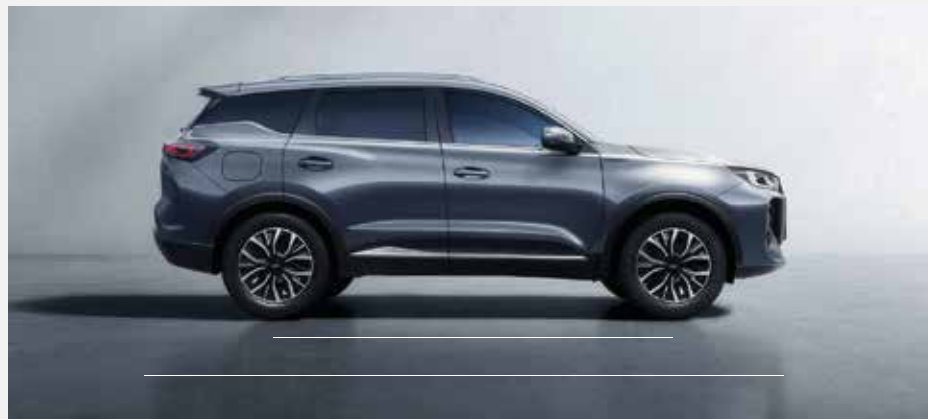
Celková délka: 4 553mm, rozvor náprav: 2 670 mm