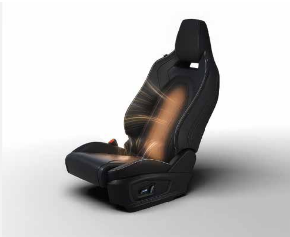
VYHŘÍVANÁ PŘEDNÍ SEDADLA S ELEKTRICKÝM NASTAVENÍM POLOHY