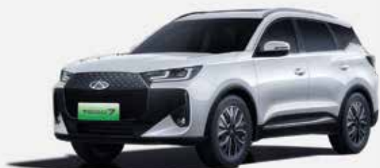
KHAKI WHITE (BW)