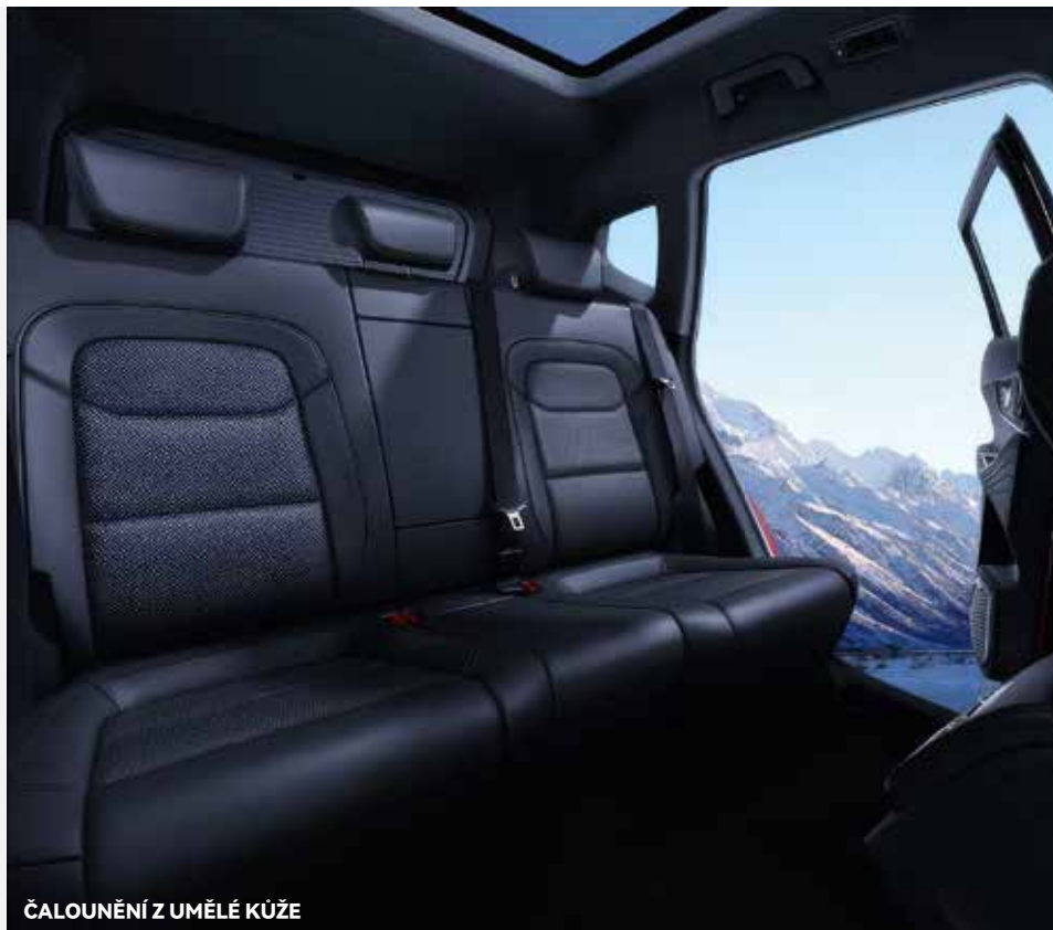
ČALOUNĚNÍ Z UMĚLÉ KŮŽE