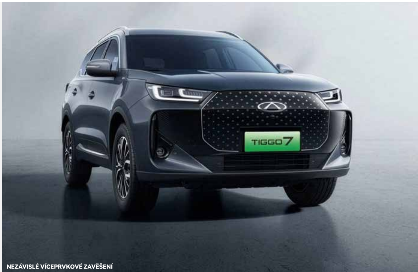
NEZÁVISLÉ VÍCEPRVKOVÉ ZAVĚŠENÍ