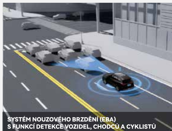
SYSTÉM NOUZOVÉHO BRZDĚNÍ (EBA) S FUNKCÍ DETEKCE VOZIDEL, CHODCŮ A CYKLISTŮ