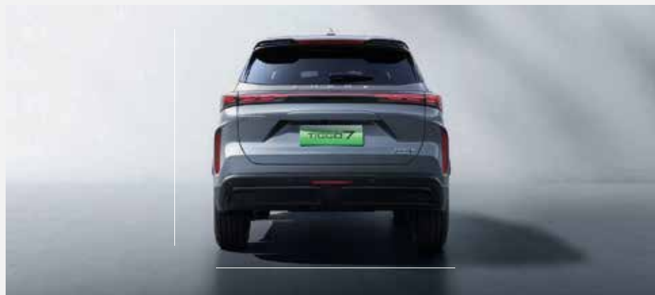
Celková šířka se zrcátky: 1 862 mm, celková výška: 1 696 mm