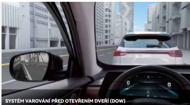
SYSTÉM VAROVÁNÍ PŘED OTEVŘENÍM DVEŘÍ (DOW)