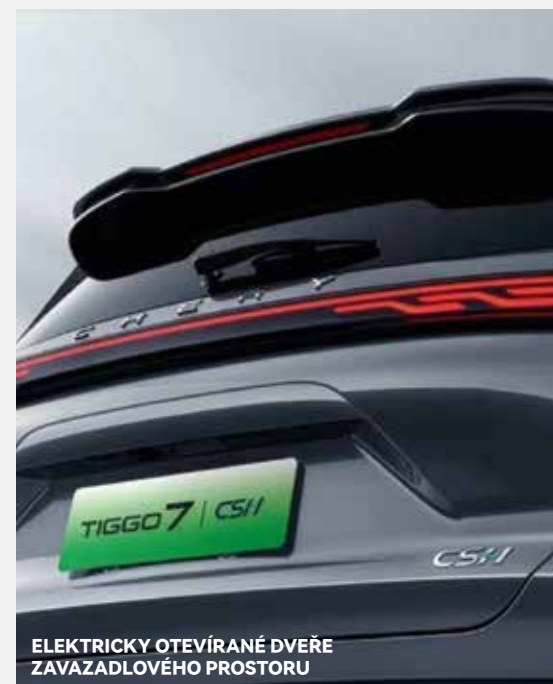
ELEKTRICKY OTEVÍRANÉ DVEŘE ZAVAZADLOVÉHO PROSTORU