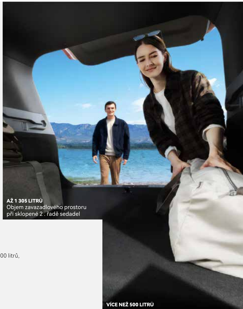
AŽ 1 305 LITRŮ Objem zavazadlového prostoru při sklopené 2. řadě sedadel