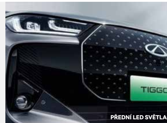
PŘEDNÍ LED SVĚTLA