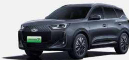
PHANTOM GRAY (GV)