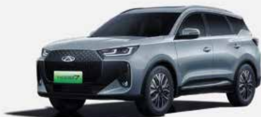
TECH GRAY (GX)