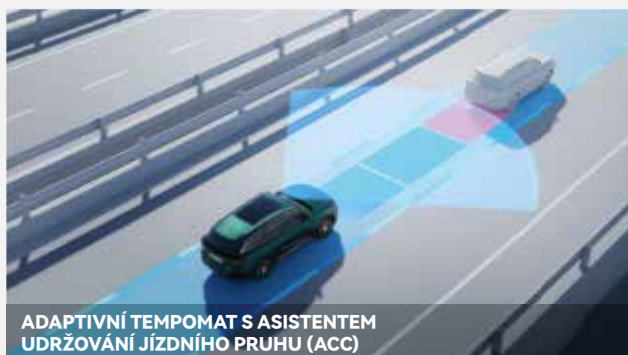
ADAPTIVNÍ TEMPOMAT S ASISTENTEM UDRŽOVÁNÍ JÍZDNÍHO PRUHU (ACC)