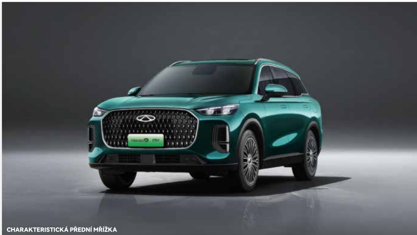
CHARAKTERISTICKÁ PŘEDNÍ MŘÍŽKA