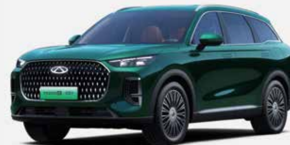
AURORA GREEN (SJ)