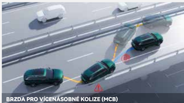
BRZDA PRO VÍCENÁSOBNÉ KOLIZE (MCB)