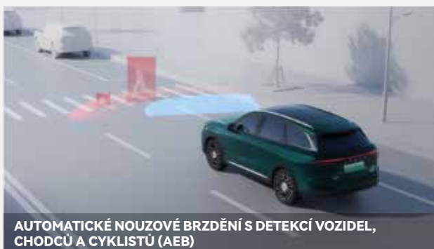
AUTOMATICKÉ NOUZOVÉ BRZDĚNÍ S DETEKČÍ VOZIDEL, CHODCŮ A CYKLISTŮ (AEB)