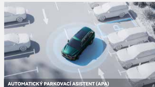
AUTOMATICKÝ PARKOVACÍ ASISTENT (APA)