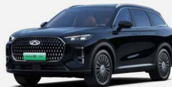
PINE BLACK (CM)