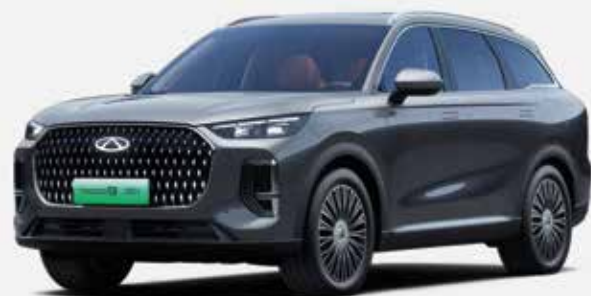
UNIVERSE GRAY (UE)