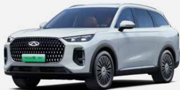
STARRY PATH WHITE(BX)