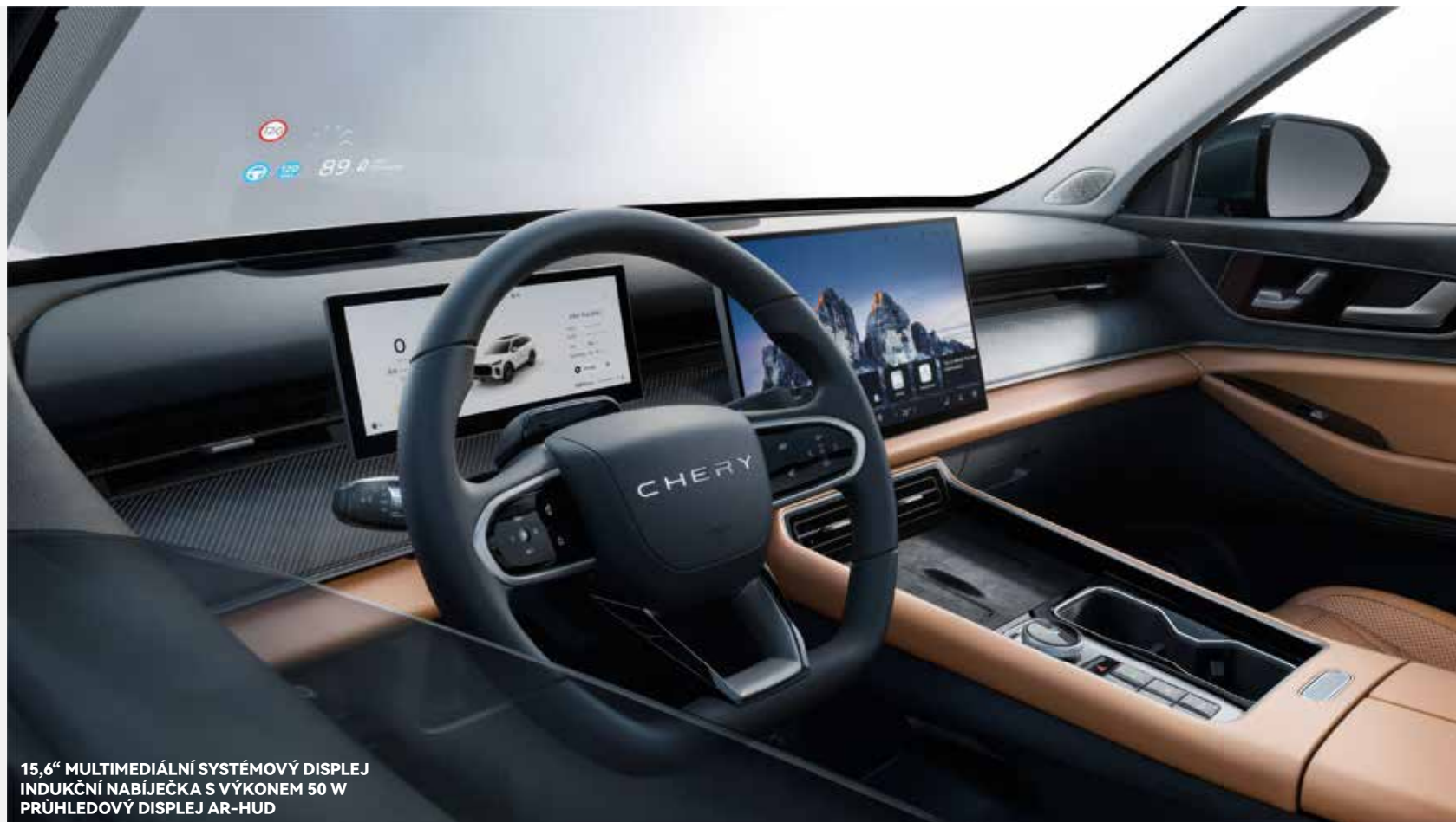
15,6" MULTIMEDIÁLNÍ SYSTÉMOVÝ DISPLEJ INDUKČNÍ NABÍJEČKA S VÝKONEM 50 W PRŮHLEDOVÝ DISPLEJ AR-HUD