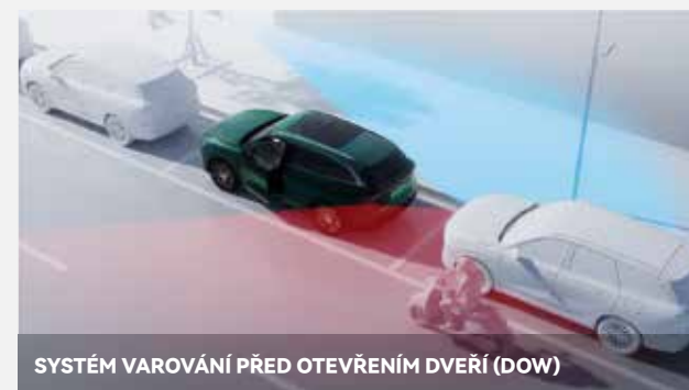
SYSTÉM VAROVÁNÍ PŘED OTEVŘENÍM DVEŘÍ (DOW)