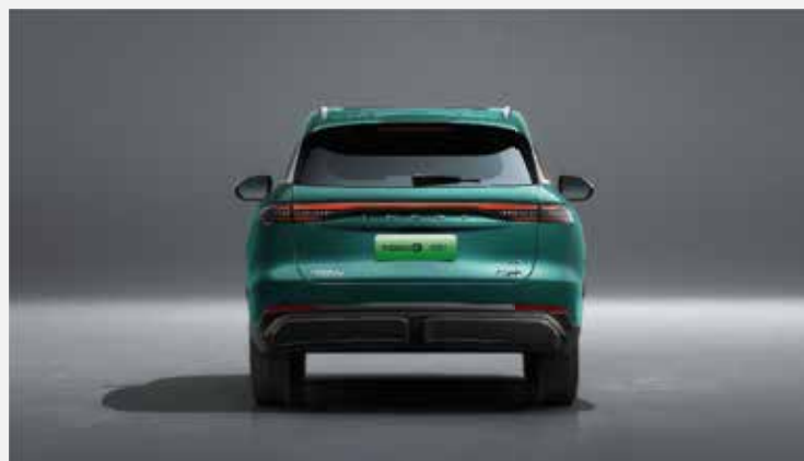
Celková šířka se zrcátky: 1 925 mm, celková výška: 1 741 mm