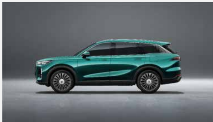
Celková délka: 4 810 mm, rozvor náprav: 2 800 mm

* Měření spotřeby paliva a emisí CO 2 byla provedena v souladu s postupem WLTP (World Harmonised Light Vehicle Test Procedure) a technickými požadavky a specifikacemi stanovenými v nařízeních Evropské unie (ES) 715/2007a (EU) 2017/1151 v posledním znění.