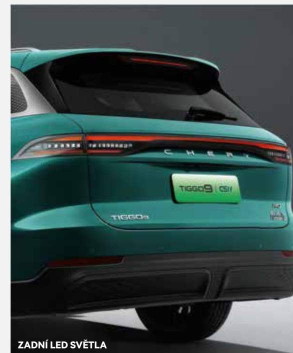
ZADNÍ LED SVĚTLA