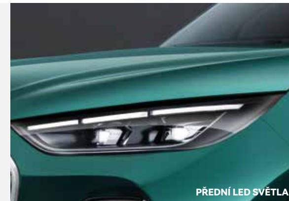
PŘEDNÍ LED SVĚTLA