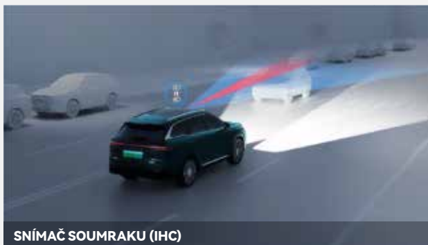
SNÍMAČ SOUMRAKU (IH)