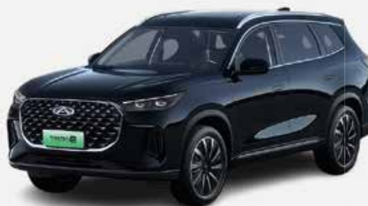
CARBON CRYSTAL BLACK (CL)