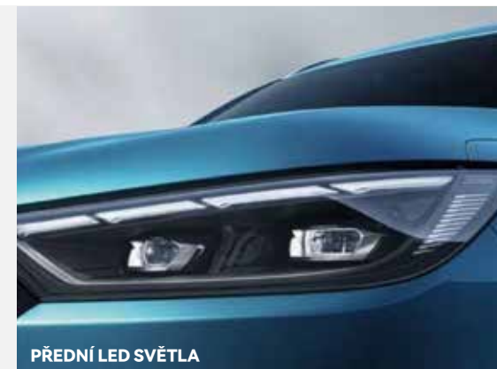
PŘEDNÍ LED SVĚTLA