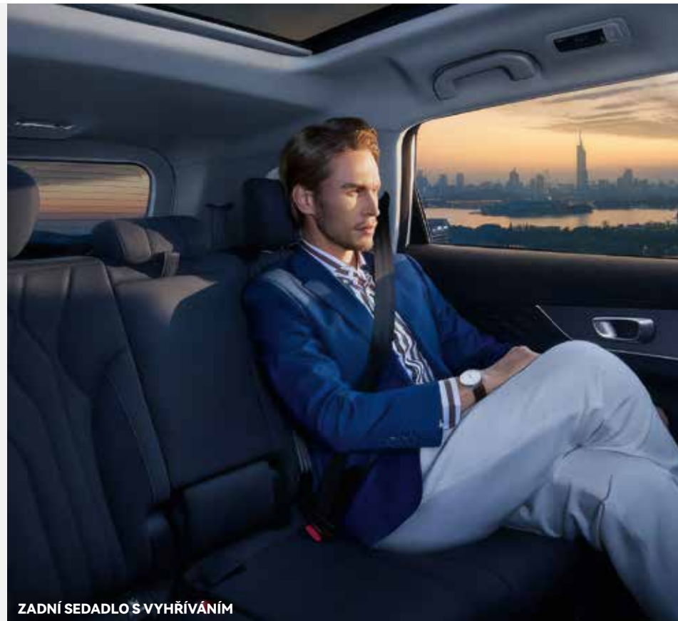
ZADNÍ SEDADLO S VYHŘÍVÁNÍM