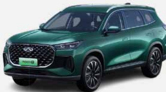
AURORA GREEN (SJ)