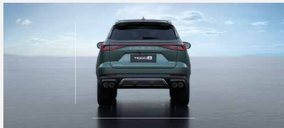
Celková šířka se zrcátky: 1 860 mm, celková výška: 1 705 mm