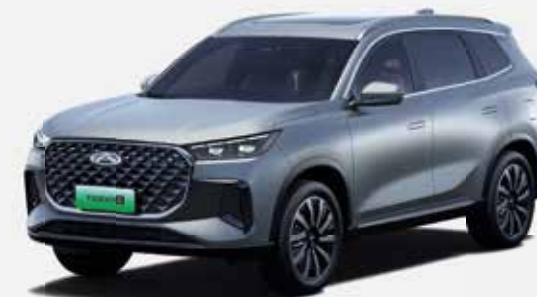
BAZALT GRAY (UV)