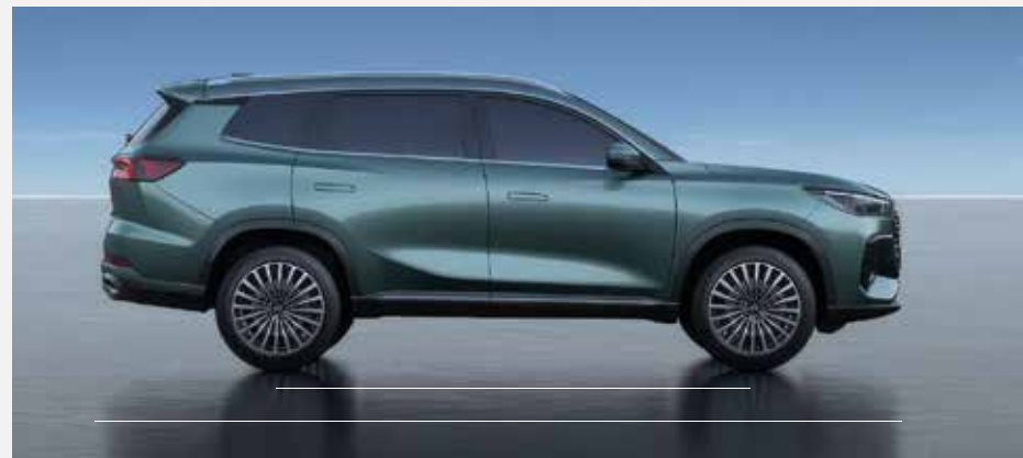
Celková délka: 4 725 mm, rozvor náprav: 2 710 mm

* Měření spotřeby paliva a emisí CO 2 byla provedena v souladu s postupem WLTP (World Harmonised Light Vehicle Test Procedure) a technickými požadavky a specifikacemi stanovenými v nařízeních Evropské unie (ES) 715/2007 a (EU) 2017/1151 v posledním znění.