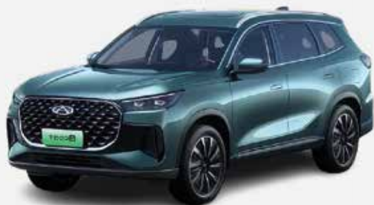
BAMBOO GRAY (UM)