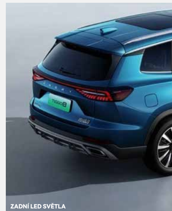
ZADNÍ LED SVĚTLA