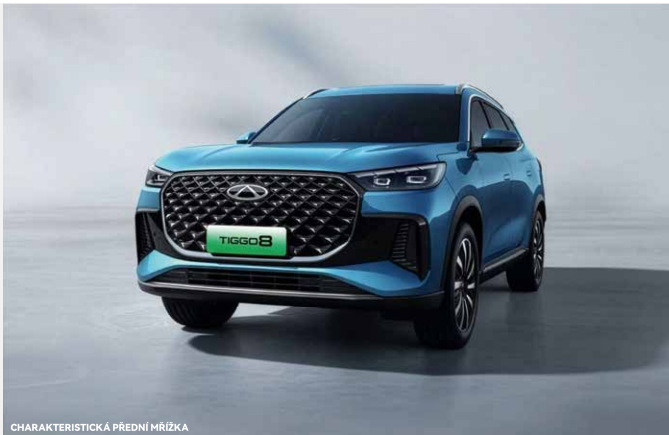
CHARAKTERISTICKÁ PŘEDNÍ MŘÍŽKA