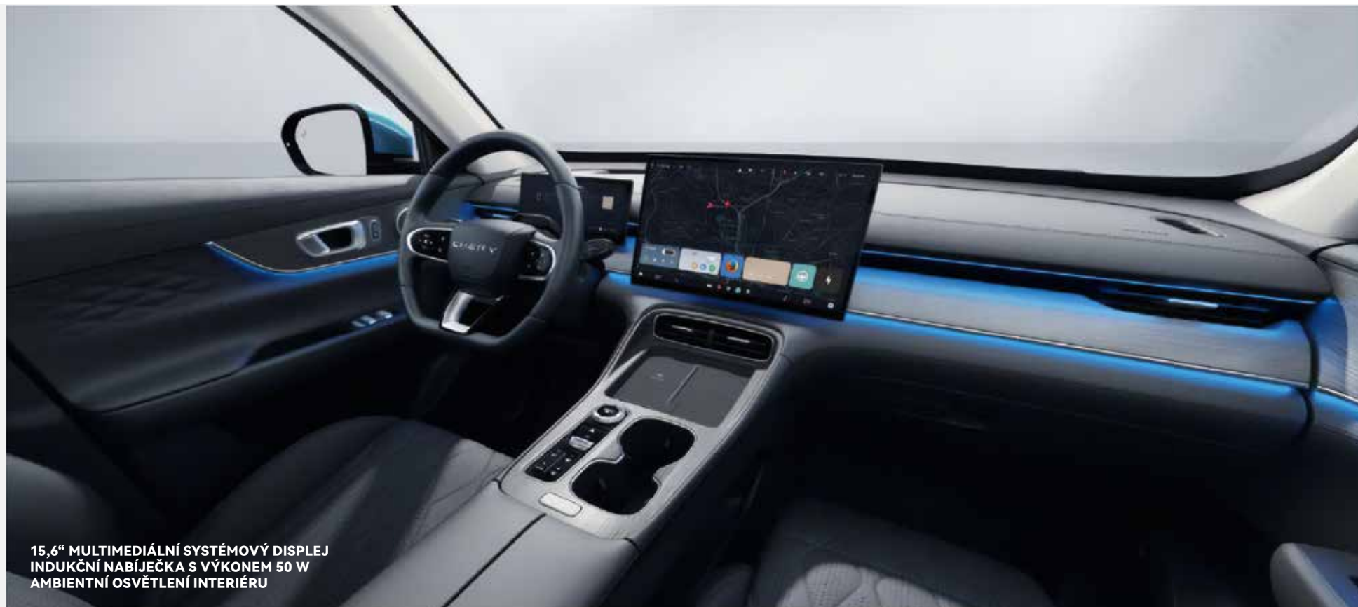
15,6" MULTIMEDIÁLNÍ SYSTÉMOVÝ DISPLEJ INDUKČNÍ NABÍJEČKA S VÝKONEM 50 W AMBIENTNÍ OSVĚTLENÍ INTERIÉRU