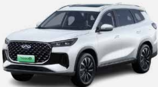
KHAKI WHITE (BW)