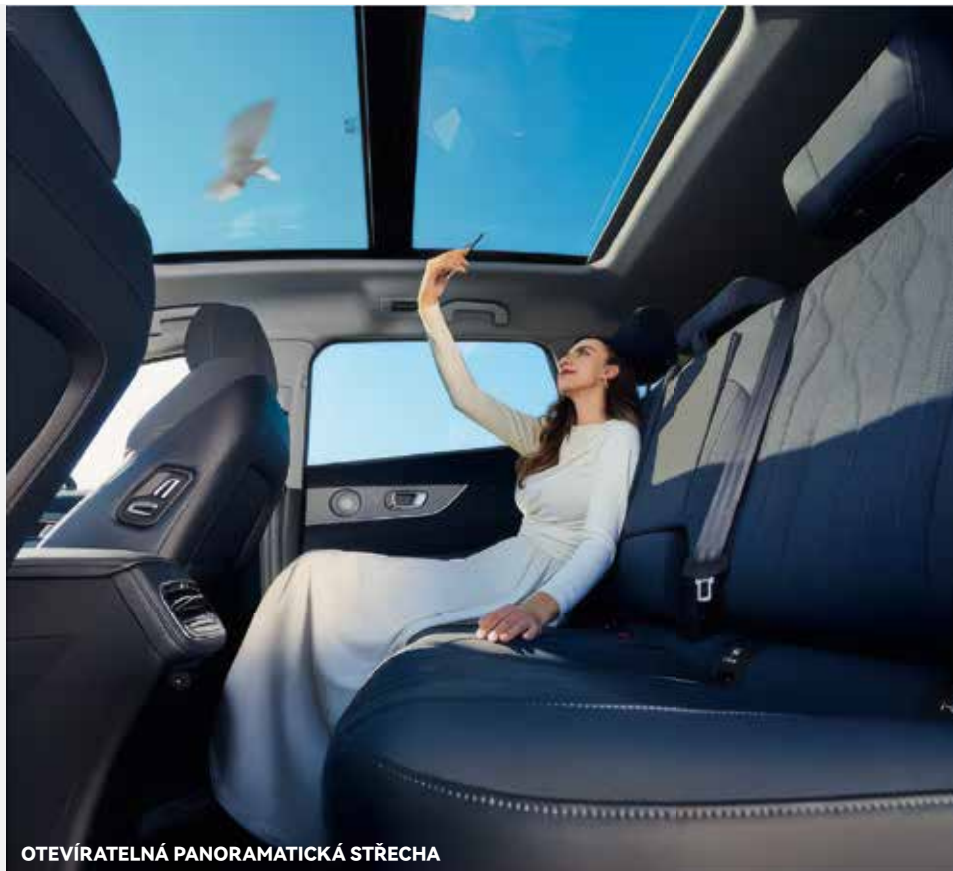
OTEVÍRATELNÁ PANORAMATICKÁ STŘECHA